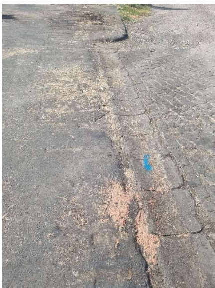
Fleischreste und sonstige Verunreinigungen direkt neben der RW-Rinne