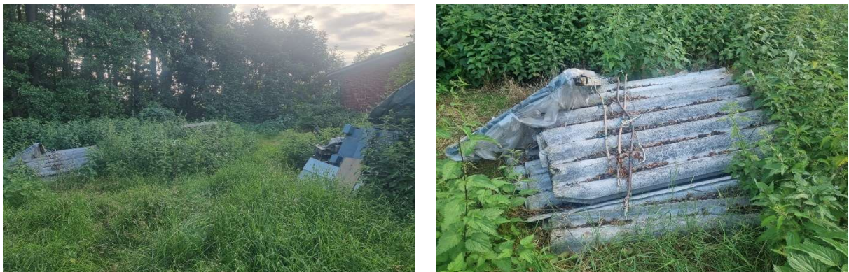
An dem Zustand hat sich nicht geändert. Da es mit Grünzeug überwachsen ist, ist es nicht mehr so gut wahrzunehmen