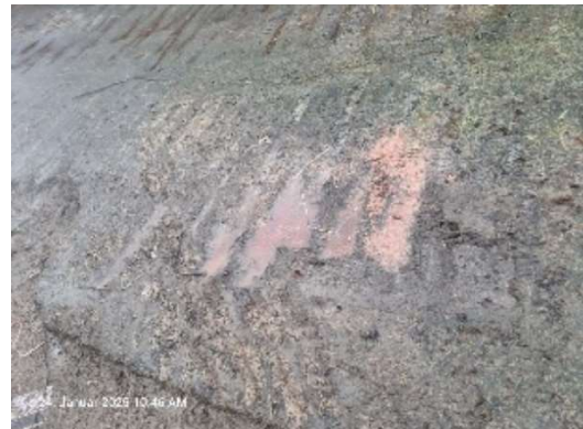
Fleischreste direkt neben der RW-Rinne