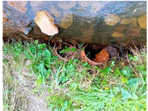
Einleitungen in den Steinfeld Bach im Bereich des Stgs