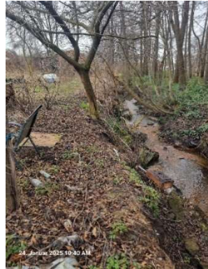
Abfälle aller Art in unmittelbarer Nähe zum Steinfeld Bach