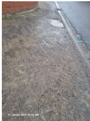
Federn, Blut und Fleischreste direkt neben der RW-Rinne