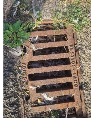
Die Regenwasserabflüsse auf dem Hof und der Straße sind gefüllt mit Federn