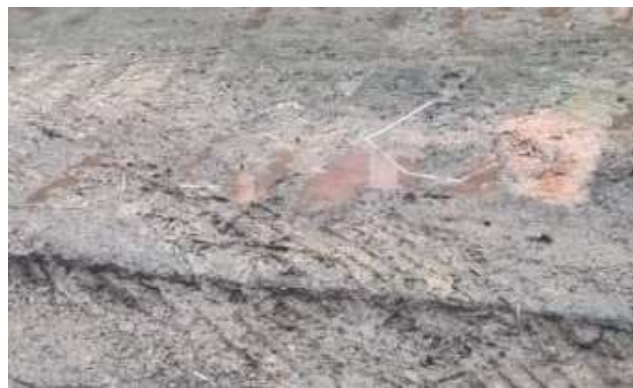
Bildausschnitt vom nebenstehenden Foto mit den Federn und Fleischresten