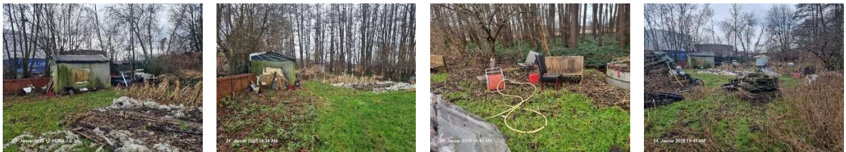
Gerümpel aller welches nur noch Schrott- oder Abfallwert besitzt ist abgelegt hinter dem Firmengelände und neben der Stallanlage in unmittelbarer Nähe zum Steinfelder Bach