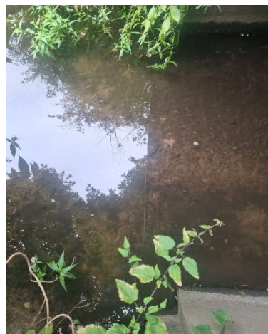
Der Steinfeld Bach nach dem Sandfang vor B214