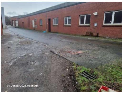
Auch neben der Halle Federn, Blut und Fleischreste direkt neben dem RW-Abfluss