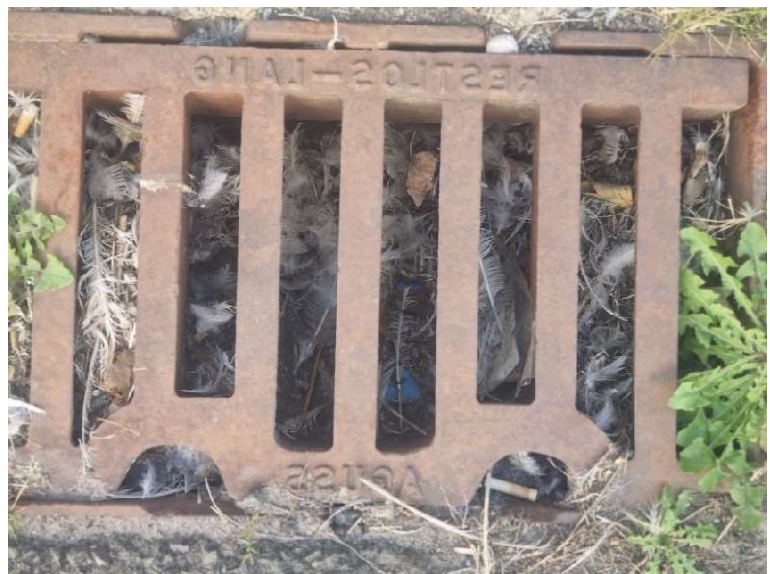
Der RW-Abfluss gefüllt mit jede Menge Federn