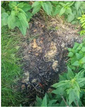
salzartige chemikalische ätzende Masse zwischen Stallanlage und Steinfeld Bach