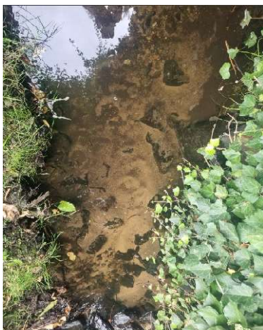
vor dem Sandfang