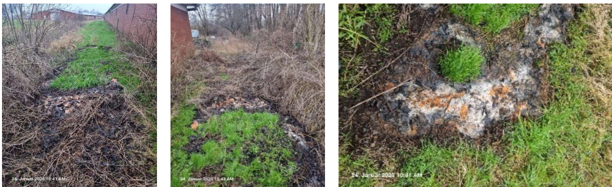
Eine undefinierbare salzartige chemikalische ätzende Masse zwischen Stall und Steinfelder Bach