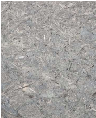
Auf der Hof- und Straßenfläche verbreitet jede Menge Federn