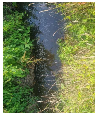
hinter der B214