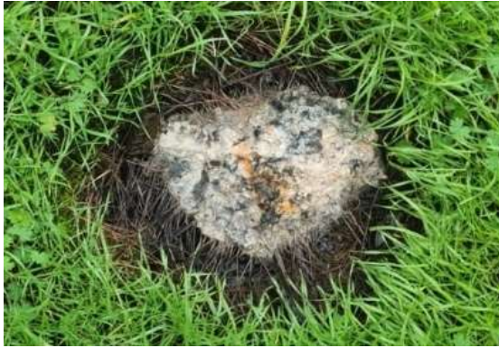
salzartige chemikalische ätzende Masse zwischen Stallanlage und Steinfeld Bach