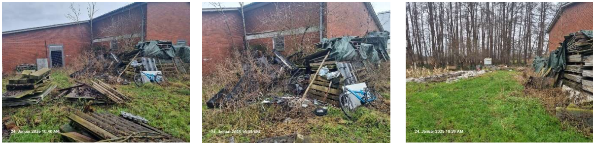
Zwischen den Firmengebäuden und dem Steinfelder Bach